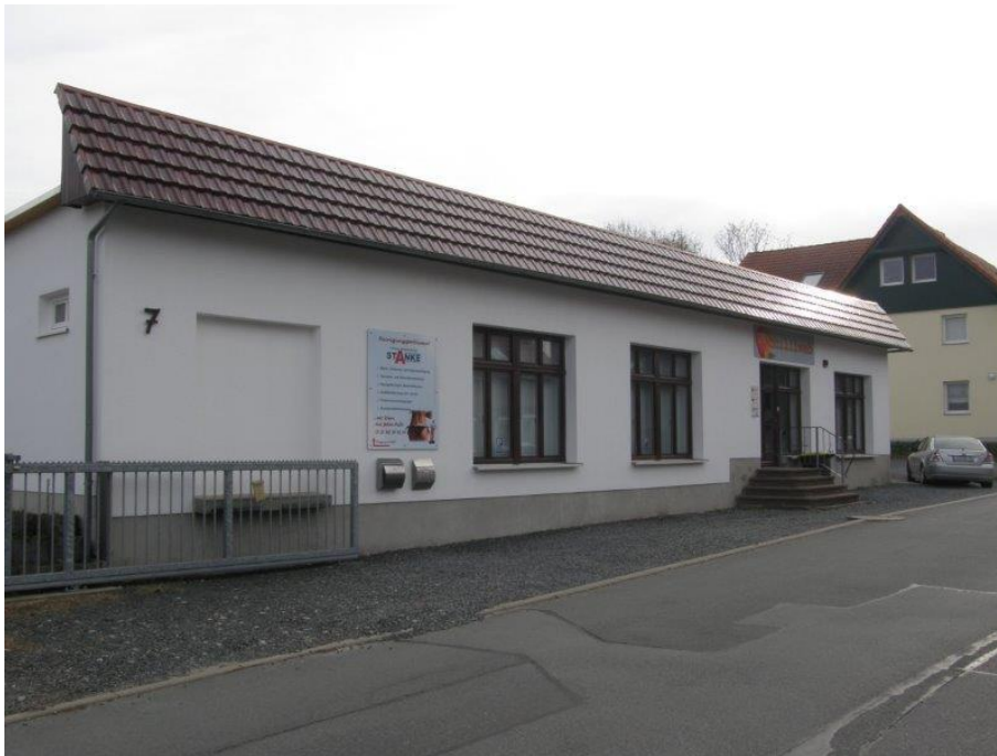
Abbildung 1: Außenansicht