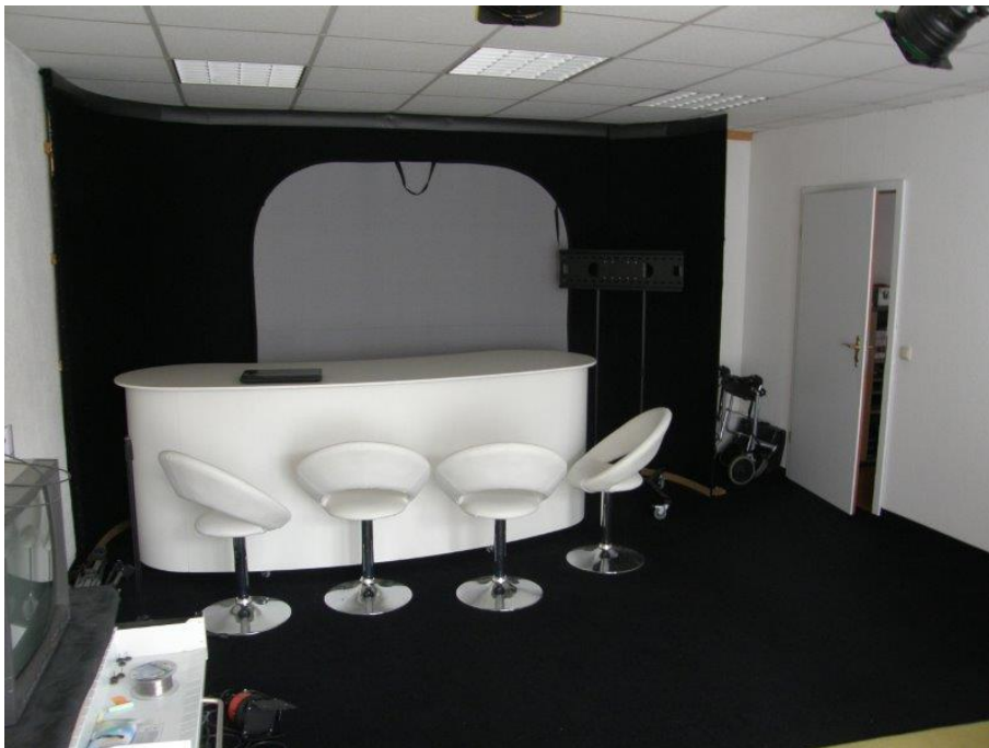
Abbildung 6: Raumnutzung als TV Studio