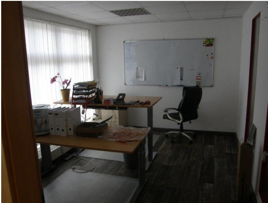
Abbildung 5: Büroraum