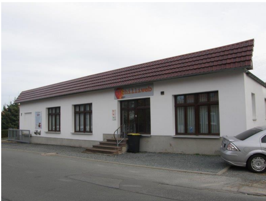
Abbildung 2: Außenansicht