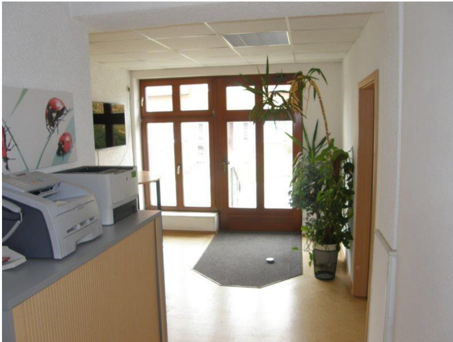
Abbildung 3: Eingangsbereich