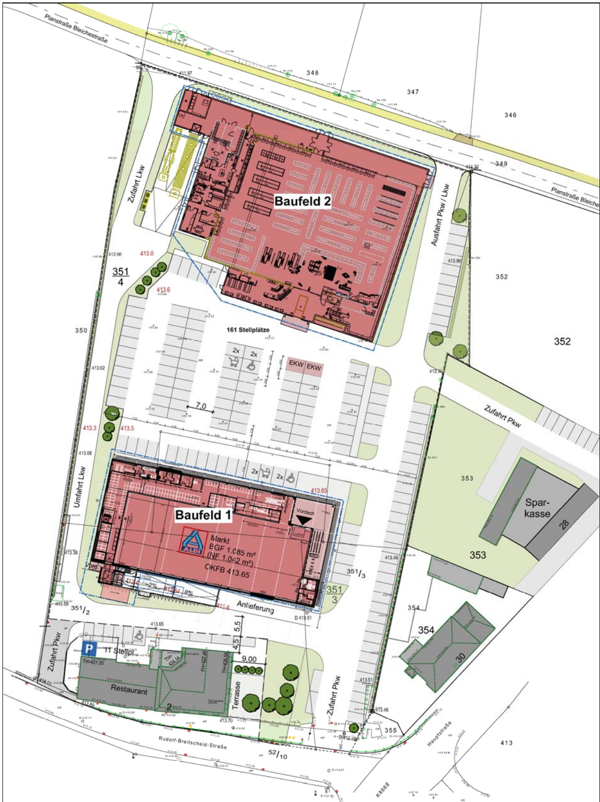
Stadt Ebersbach-Neugersdorf, vorhabenbezogener Bebauungsplan „Neugersdorf R.-Breitscheid-Straße/Hauptstraße“ - Planungsbüro Bothe -